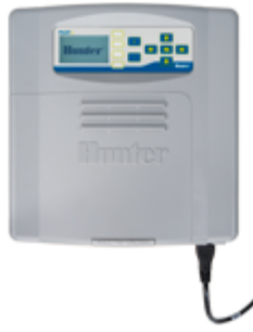
PILOT-FC Plastic Pedestal